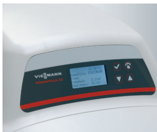
Sterowana elektronicznie głowica udostępnia wiele funkcji