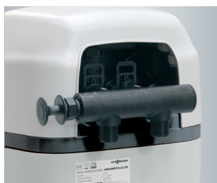
By-pass umożliwia szybki montaż urządzenia