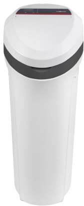
Aquahome DUO SMART