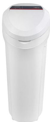
Aquahome 30 SMART