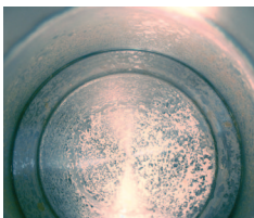
Twarda woda powoduje osadzanie się kamienia na sprzętach mających kontakt z wodą, np. w czajniku.