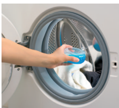
Aż 97% wody w domu zużywamy na cele gospodarcze, np. pranie.

W kuchni i łazience wciąż musisz szorować uporczywe osady z kamienia? Po kąpieli Twoja skóra i włosy są wysuszone? Czas pozbyć się twardej wody!