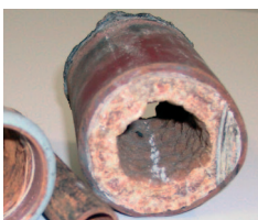
Twarda woda to zagrożenie dla kotłowni – powoduje m.in. znaczne obniżenie sprawności cieplnej instalacji grzewczej.