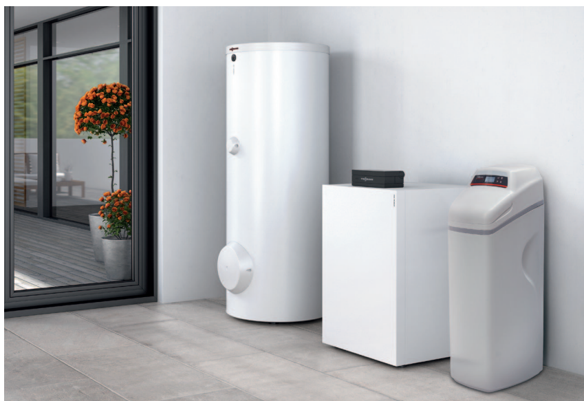
Kamień kotłowy zmniejsza sprawność kotła i procesu grzewczego w instalacjach centralnego ogrzewania i ciepłej wody użytkowej.

Urządzenie dostępne w sprzedaży tylko w sklepie internetowym Viessmann: www.sklep-viessmann.pl