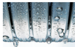
Wymiennik ciepła Inox-Radial

Warunki gwarancji: www.viessmann.pl/gwarancja