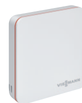
Termostat ViCare zapewnia wyższy komfort ogrzewania (wyposażenie dodatkowe)