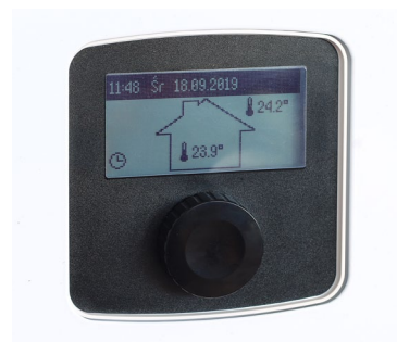
Łatwy w obsłudze regulator kotła

Vitotron 100 może współpracować z dowolną instalacją c.o. oraz z wymiennikiem c.w.u.. Kocioł wyposażony jest w przeponowe naczynie wzbiorcze o pojemności 5 litrów oraz w niezbędną armaturę zabezpieczającą. Przy współpracy kotła z wymiennikiem c.w.u. możliwa jest regulacja temperatury wody oraz włączanie pompy cyrkulacyjnej zgodnie z ustawionymi programami dobowymi i tygodniowymi.